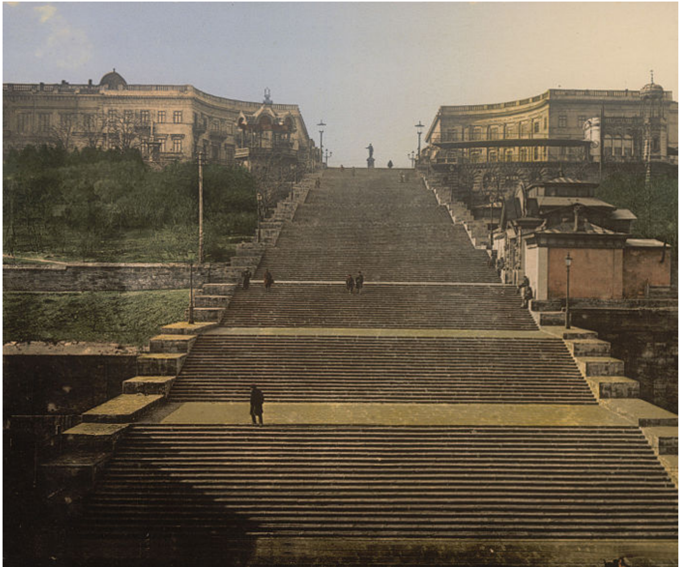
De 'Potemkintrappen' in Odessa.