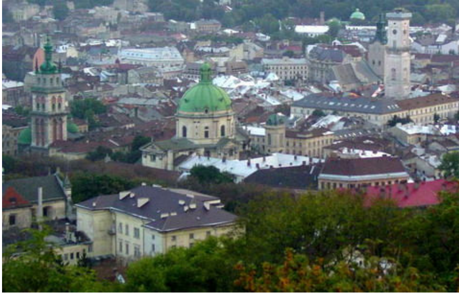
Het centrum van Lviv