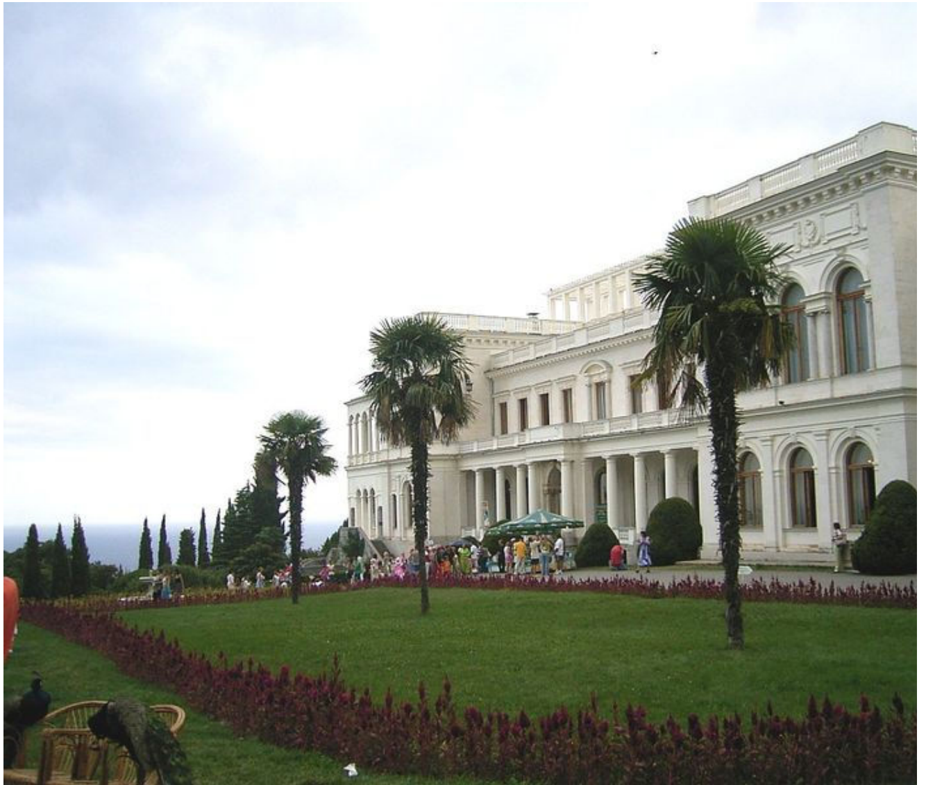
Het Livadia Paleis in Jalta